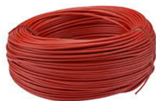
PRZWÓD YLgY PODWÓJNA OTULINA