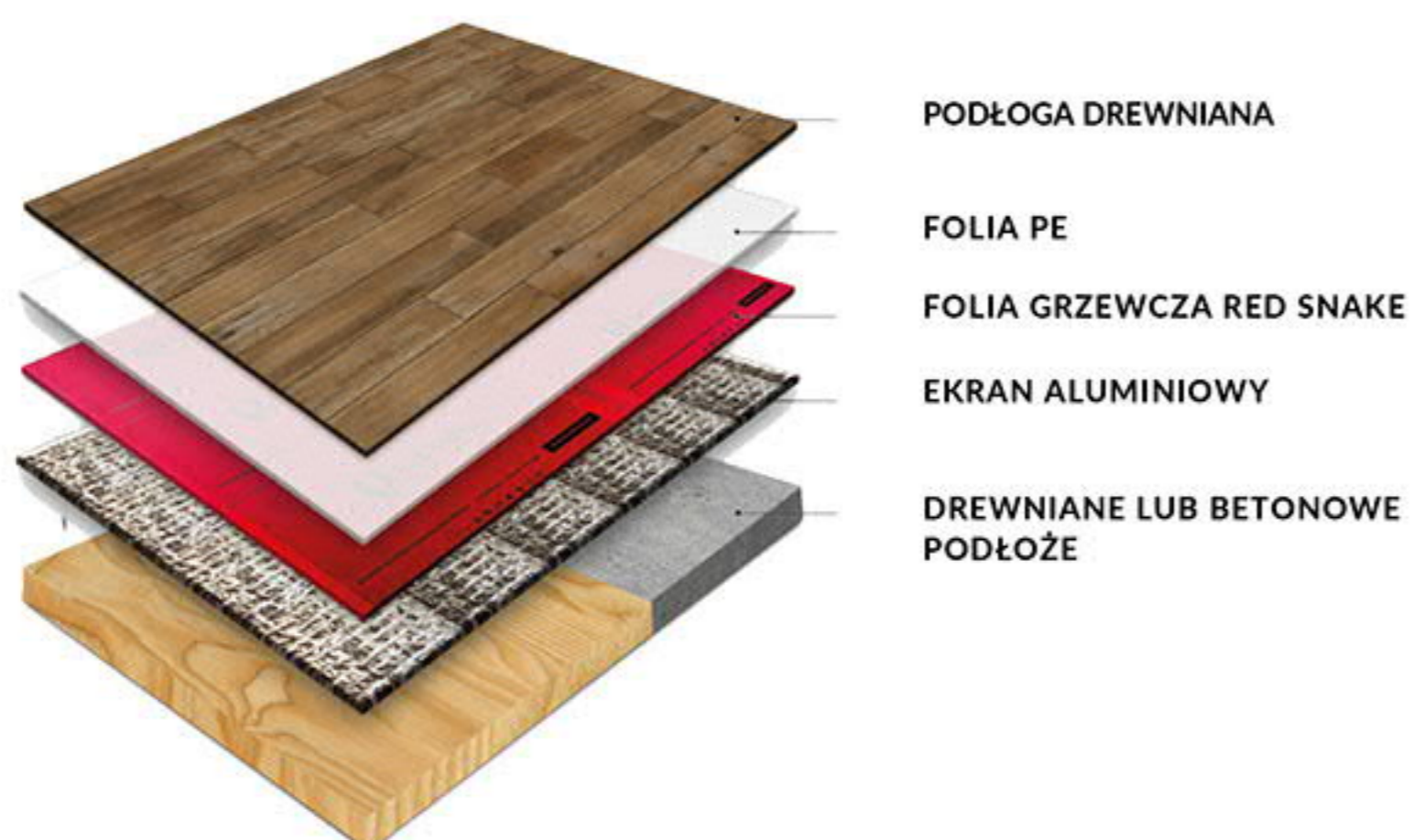
SCHEMAT UŁOŻENIA NA PODŁODZE Z PANELAMI